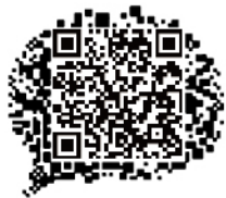
学校招办网址二维码